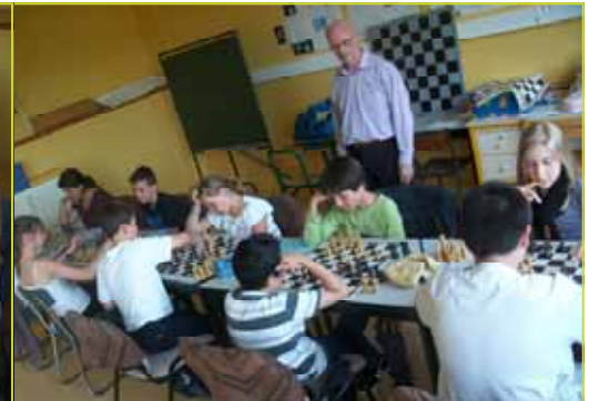
Cours d'échecs pour les CM2 où la concentration est de rigueur !