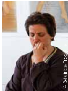
Un travail respiratoire et...