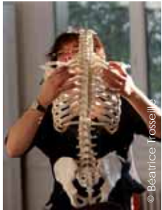
Du travail sur la connaissance de soi