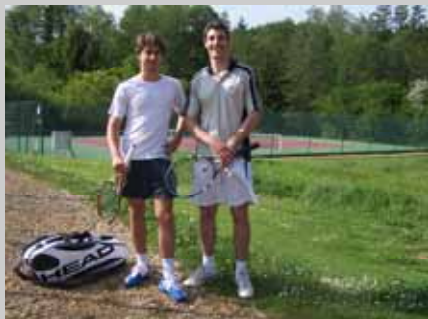
Les finalistes du tournoi interne Messieurs

Le vainqueur du tournoi interne Messieurs avec le Président et le responsable des animations