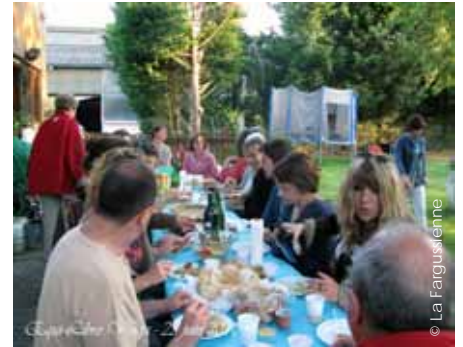
...un repas de fin d'année bien mérité !