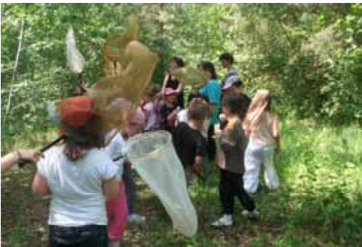
Les CE1 à la découverte des insectes à l'OPIE (Office Pour les Insectes et leur Environnement).