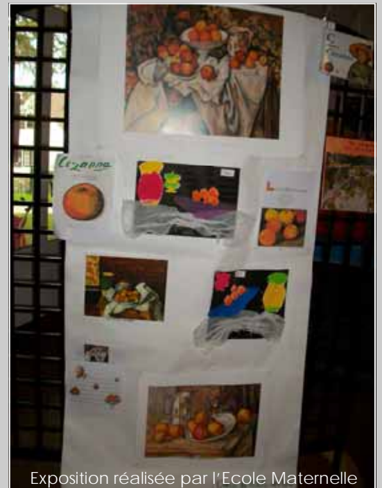
Exposition réalisée par l'Ecole Maternelle

"Un ange qui transporte l'âme du grand chêne au paradis."