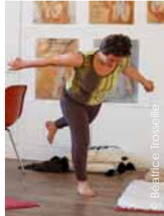
Une question d'équilibre