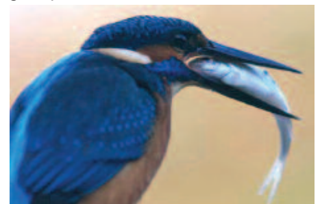
Martin-pêcheur en pleine action

Le balbuzard pêcheur , rapace de la famille des aigles, dont l'aire de répartition est mondiale, mais qui avait disparu de France au XIX ème siècle. Réintroduit il y a une vingtaine d'années, il y est représenté maintenant par une cinquantaine de couples, dont la moitié niche en Corse. Il séjourne assez souvent sur Saint Hubert au printemps et en automne. Il se distingue facilement par sa taille (envergure atteignant 1,80 m), son vol dégingandé et son plongeon brutal pour s'accaparer de gros poissons.