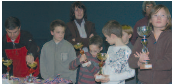
Les Champions récompensés

Souhaitons bonne chance à tous ces champions pour les Championnats Académiques du 9 mars qui servent de qualification pour les Championnats de France.