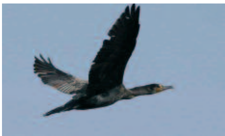
Un cormoran en plein vol

Créés à la fin du XVII ème siècle pour satisfaire aux besoins d'alimentation des jets d'eau du château de Versailles, les étangs de Saint Hubert - terme générique désignant une enfilade de six étangs - s'étendent sur 5,2 km, recouvrant 200 hectares, à une altitude d'environ 170 m. Ils se situent au cœur et au plus haut du plateau d'Yvelines, sur une ligne de partage des eaux matérialisée par la digue de la Canarderie : du côté de Saint-Léger les eaux s'écoulent vers la Seine en aval de Paris, tandis que du côté du Perray, elles rejoignent la Seine également, mais en amont de Paris. Le caractère très humide de cette région tend à conforter l'hypothèse selon laquelle les Yvelines doivent leur nom au mot celte " ioline " signifiant " riche en eaux ".