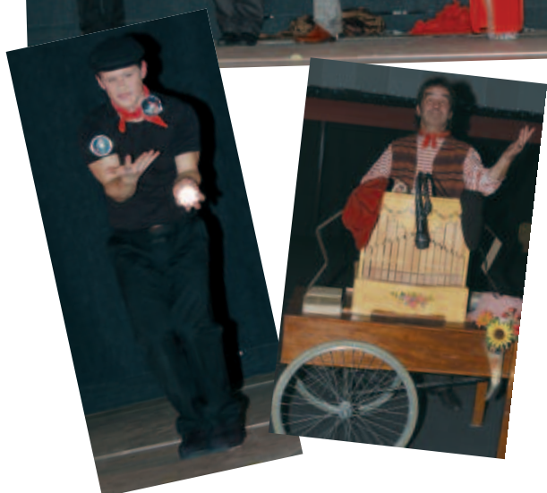
Joie et bonne humeur étaient au rendez-vous à la soirée Cabaret organisée par la Municipalité