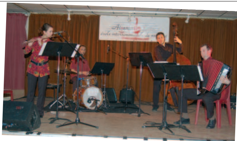
L'ensemble "Gopak Quartet" a enchanté le public de la salle polyvalente avec ses musiques traditionnelles d'Europe de l'Est