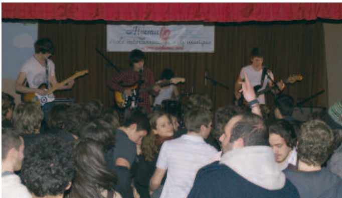
Grande affluence pour la soirée rock

reservation@aidema.net , jusqu'à 48 heures avant le concert